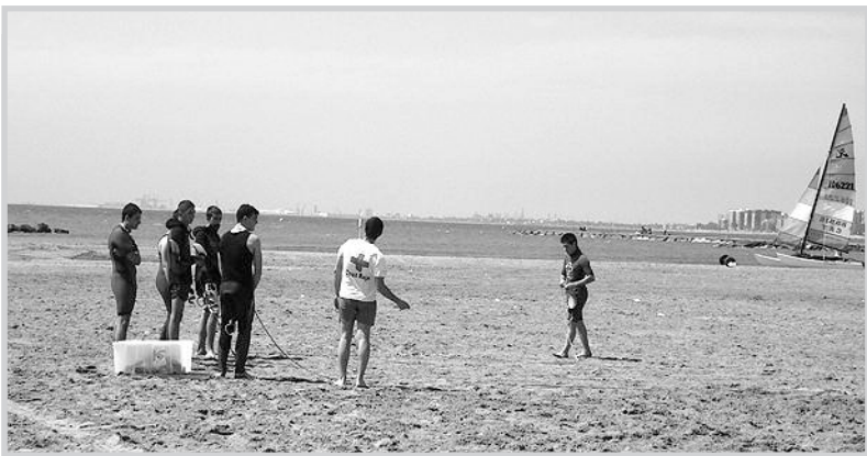
Curso de Socorrismo Acuático de Cruz Roja Teruel. La Asamblea de Cruz Roja Castellón ha formado alumnos turolenses en socorrismo acuático.

Procesión en San Blas. San Blas vivió este domingo la Procesión de la Virgen de la Piedad, en la imagen de la derecha, en el marco de sus fiestas. Tras la citada procesión se repartieron roscones bendecidos y se degustó una paella gigante.